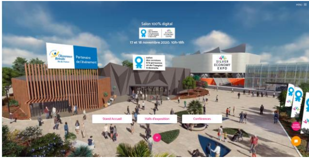
Palais des Congrès virtuels